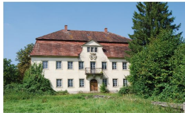
Das Horner Schloß

Mit der „Drei Hütten – Tour im Leintal“ laden die drei Vereine sowohl zu einer schönen Wanderung wie natürlich auch zu einer zünftigen Einkehr ein. Alle drei Hütten bieten ihren Gästen neben Getränken aller Art, Kaffee mit selbstgebackenen Kuchen sowie eine reichhaltige Vesperkarte. Bei schönem Wetter gibt's bei allen drei Hütten die Möglichkeit draußen zu sitzen, auch für die Kinder ist im Außenbereich der Hütten auf den Spielplätzen einiges geboten.