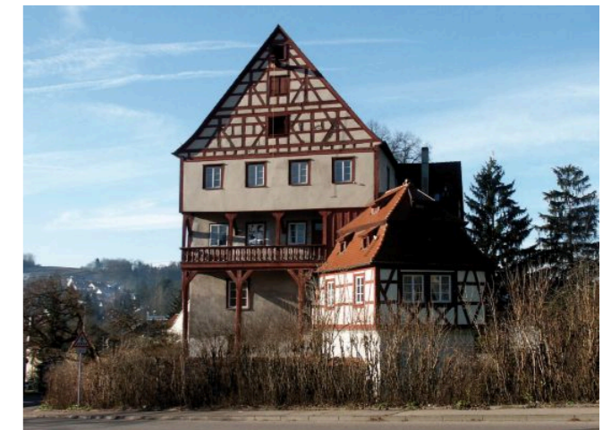
Das Leinzeller Schloß

Der Heuchlinger Albverein, die Leinzeller Skizunft und der Turnverein Horn wünschen allen Spaziergängern und Wanderern viel Spass beim Bewandern der Drei Hüttentour im Leintal und freuen sich auf Ihre Einkehr in den Hütten.