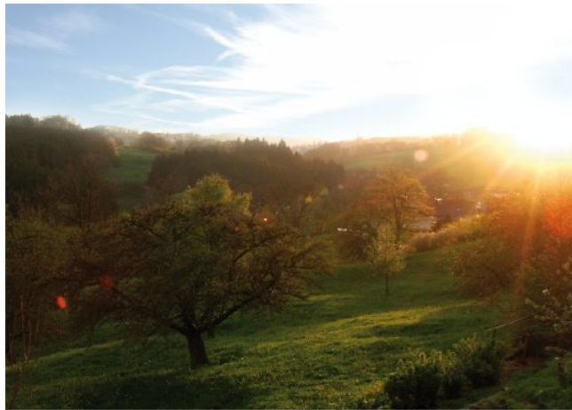
Blick von Horn ins Leintal Richtung Leinzell

Wandern verbindet! – Das dachten sich auch der Turnverein Horn, die Skizunft Leinzell und der Schwäbische Albverein Heuchlingen, deren Hütten bzw. Wanderheime im schönen Leintal, und somit direkt vor der Haustüre liegen. Da in allen drei Vereinen das Wandern seit je her groß geschrieben wird, möchte man gemeinsam die drei schönen Vereinshütten und eine interessante Wandertour vorstellen.